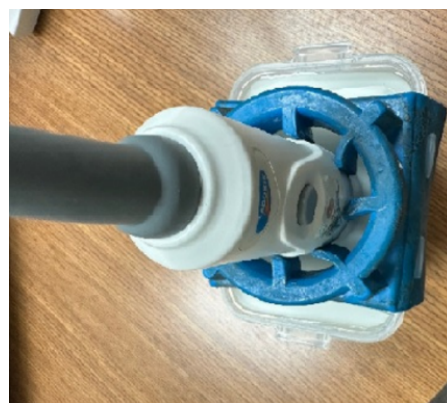
Fantôme de vessie, support de sonde et sonde de scanner de vessie